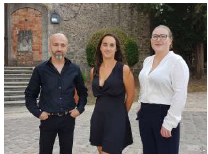
L'équipe du Musée du château