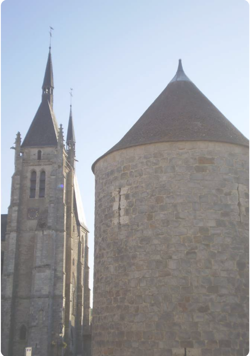
Eglise Saint Germain l'Auxerrois et tour d'angle nord du château