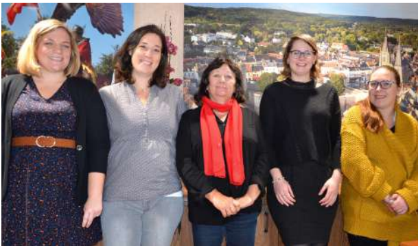
L'équipe de Dourdan Tourisme